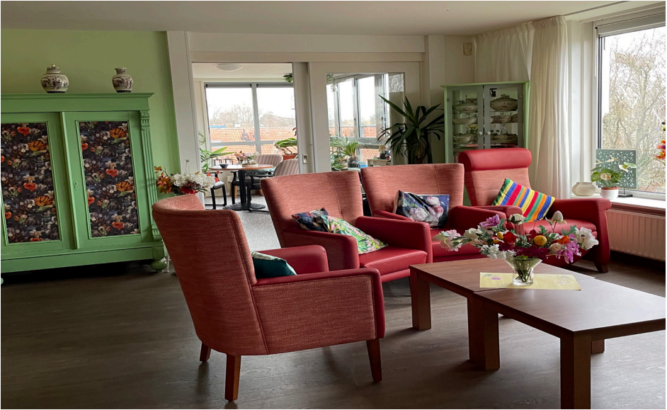
Een van de gezamenlijke huiskamers.

Zelfstandig wonen is voor mensen met ernstige vergeetachtigheid (dementie) vaak niet meer verantwoord. Ze kunnen niet goed voor zichzelf zorgen en hebben moeite met het aanbrengen van dagstructuur. Op onze afdeling Kleinschalig wonen krijgen ze de verzorging en begeleiding die ze nodig hebben.